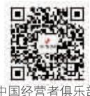
中国经营者俱乐部