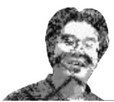
作者为财税史学者

人的税收优惠,机器人税负增加,因此被认为是征收了机器人税;机器人税也可能是一种消费税(货物税),如果这种税收向生产厂家征收,那么是消费税,只征收一次,税负随价格转移给终端用户;如果对机器人拥有者征收,可以分年度多次重复征收,那么,它就是财产税,与车船税的性质类似;如果针对生产经营部门使用的机器人征收,那么,就是一种资本税或生产要素税。