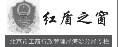
北京市工商行政管理局海淀分局专栏

景区中购买商品和游乐产品时,一定要选择景区内正规场馆,切勿相信个人游商的忽悠,在接受服务前要注意留存消费凭证,一旦遇到消费者权益受到侵害,或与商家产生纠纷时,应及时向相关部门反映,保护自己的合法权益。