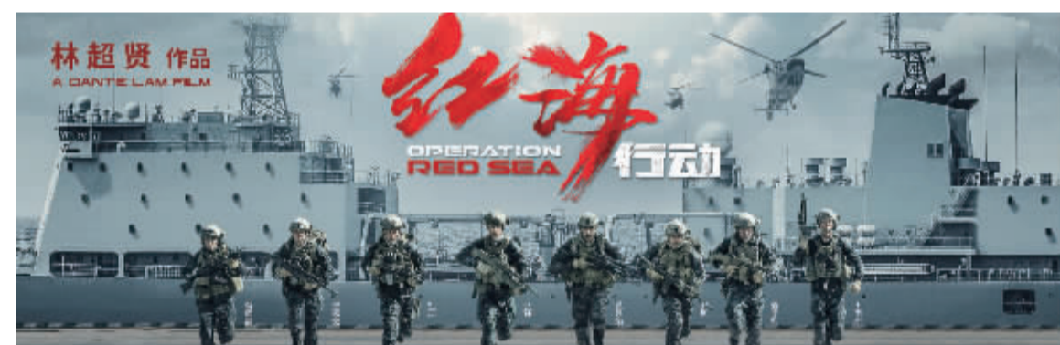
上映22天票房突破32亿元,爱国主义军事大片《红海行动》取得了巨大成功,作为主要授信方的北京银行的资金支持功不可没。

知识“无形”,资本“有”价。如何将“无形的知识”转化成“有形的价值”,北京银行在长期探索过程中,