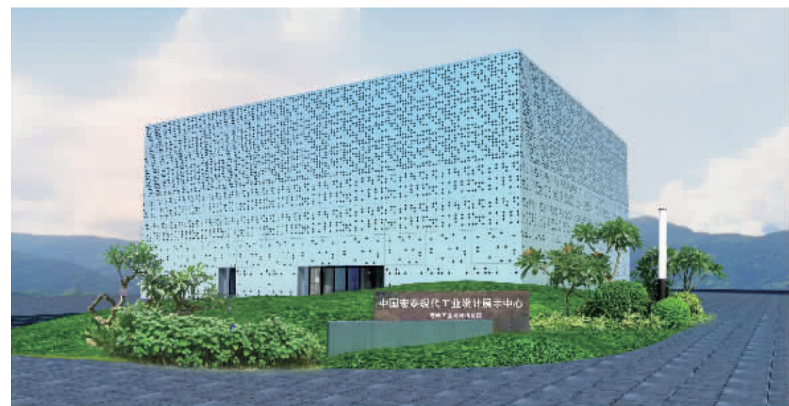
中国宏泰现代工业设计展示中心(宏泰工业设计博物馆)

设计的未来发展方向。并以出众的创意设计、新颖的技术展示、鲜亮的艺术效果，打造一个集科技、科普、教育、观赏、体验为一体的国家工业设计新型文化科普基地，以期