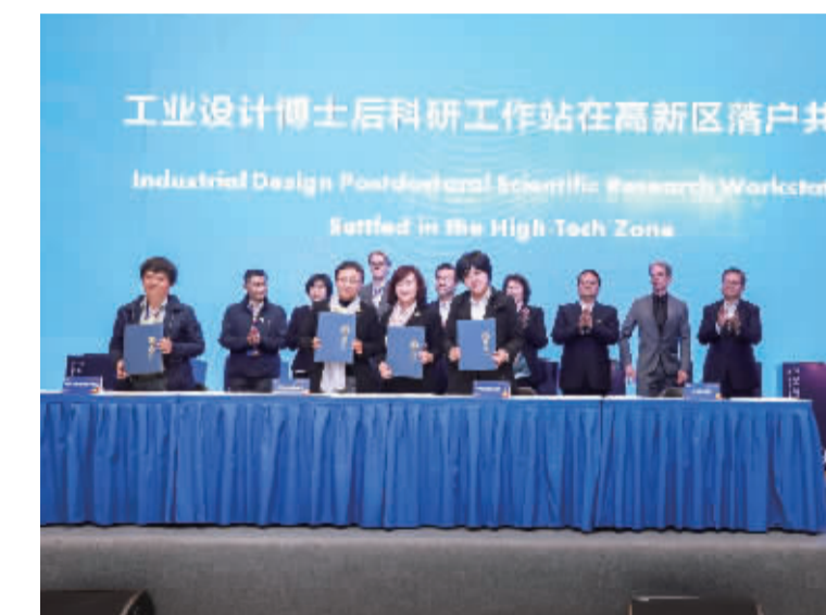
宏泰智合携手湖南大学等四方共建河北工业设计博士后科研工作站

在工业设计产业领域，中国宏泰发展在秉承拓宽对外交流渠道、广泛参与国际交流合作的战略指引下，通过与各国政府和知名企业建立合作关系，实现着新一轮的跨越式发展。