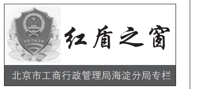
北京市工商行政管理局海淀分局专栏

确保服务到位。畅通全国和北京市12315互联网平台、热线、来信等多种渠道，及时处理消费者的投诉、举报问题，满足消费者需求，竭力挽回经济损失。确保维权服务到位，保护消费者合法权益。