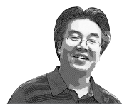
作者为财税史学者

每一项扣除不可能很高。这是因为，如果实际发生的相关费用都能扣除，那么，几项扣除之后，收入很高的人可能也无需纳税，甚至收入很高的人，会节约更多的税款，造成税款大量流失。新浪财经频道的一篇文章曾经假设如贷款500万买一套房子，贷款20年，按照目前4.9%的基准利率，利率支出就达到了285万元，分摊到每个月就是1.28万元。每月扣除1.28万元的房贷利息，有可能吗？我感觉可能性很小，如果每月扣除房贷利息1.28万元的话，月收入2万元的人，就已经无需纳税了。而其他几项扣除还未适用呢。