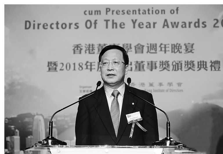
中国太保集团董事长孔庆伟在“2018年度杰出董事奖”颁奖典礼现场致辞

作为财产保险服务供应商闪亮登台。据悉,中国太保的服务团队依托全集团资源,为进博会提供了涵盖知识产权保险、关税保证保险、网络安全保险等新型风险和财产保险、公众责任险等传统风险的一揽子财产保险解决方案,总保额高达350亿元。展会期间的各国展品,从高精尖的精密仪器、智能装备,到价格不菲的珠宝首饰,都获得了由中国太保提供的基础保险保障。