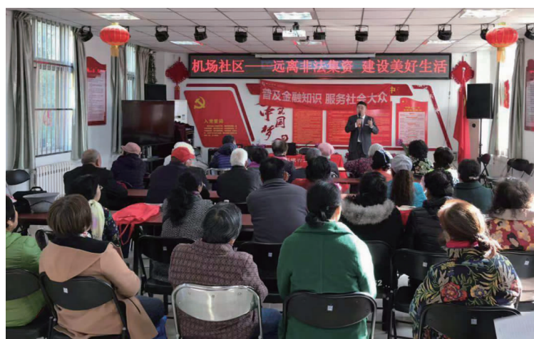
图为北京分行走进社区普及金融知识。

为进一步推进“双基联动”向县域支行延伸,锦州银行在县域网点中均设立了“三小”信贷服务中心,设专人与县、乡、村基层党组织对接,负责小微与“三农”业务咨询、辅导和信贷业务受理;借助双基联动信贷服务工具,深入田间地头现场为农户办理即时信贷业务,实现从调查到放款的全程服务送货上门,扩大了“三农”服务半径,解决了服务“三农”最后一公里问题。同时,各县域支行组成了宣传小分队,在县内各级党组织的配合下,定期下乡进村开展义务劳动、医疗义诊、电影放映等暖心活动,拉近了银行基层网点与县、乡、村民的感情;定期组织“金融知识下乡进村”活动,制定并执行了“每周一村”“每周一集市”方案,每周利