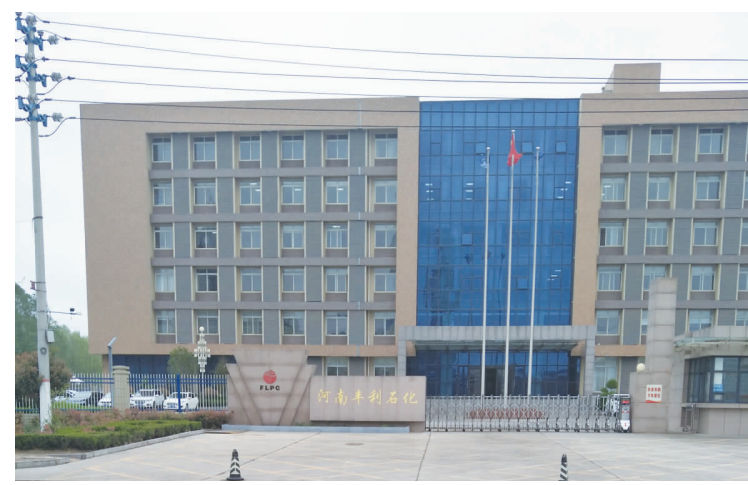
图为丰利石化厂区。

丰利石化前身为范县炼油厂,始建于1979年,国家配给原油指标28万吨/年。2000年,国家清理整顿小炼油厂时,考虑到范县是国家级贫困县、革命老区、中原油田生产腹地,将该企业炼油能力和原油指标予以保留,其也成为河南省唯一一家地炼企业。2011年,随着产品质量升级和企业发展的需要,该公司组建成为丰利石化,并搬迁扩建至专业化工业园区内。