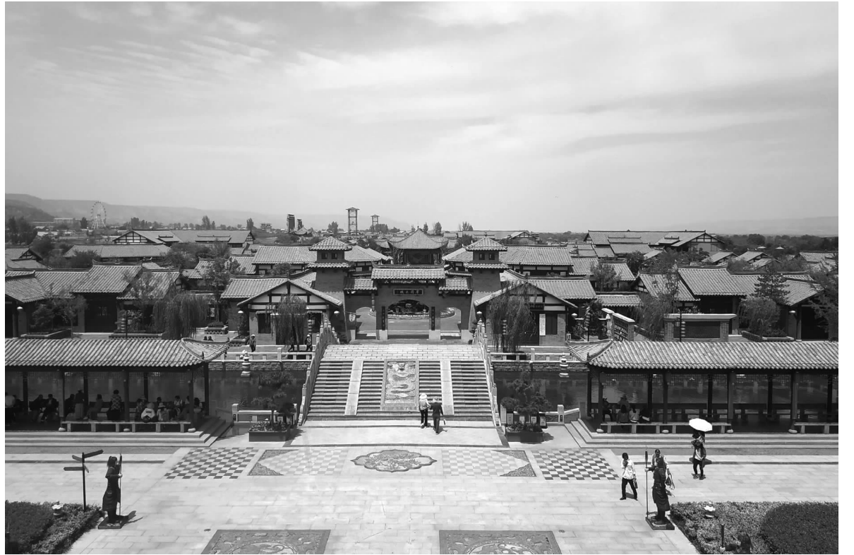
在合阳湿地还存在一个仿古建筑群——莘国古城,已基本建成,属未批先建,违反了国家环境保护法律法规的相关规定。

“洽川湿地是洽川风景区的核心地带,肩负着巨大的生态功能,是珍稀野生动植物的乐园。在旅游开发中,由于投资商的经营目的驱动,往往造成过度开发而影响到湿地生态的保护与修复,使得湿地资源污染甚至退化。”上述业内人士指出,对于洽川区域社会经济发展来说,发展湿地生态旅游是脱贫致富的良好途径,然而湿地又是一种相对脆弱的生态系统,应以保护为主,开发为辅,对于刚开发的湿地旅游资源,计算好湿地旅游环境承载力尤为重要。