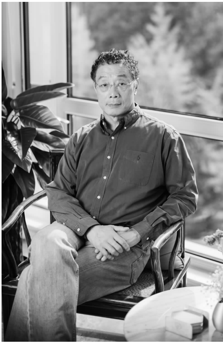
中国城市和小城镇改革发展中心首席经济学家李铁

自1992年从事城镇化研究工作开始,李铁参与并见证了多个关于城镇化政策的起草和出台,也奠定了此后多年关于城镇化的研究领域和方向。