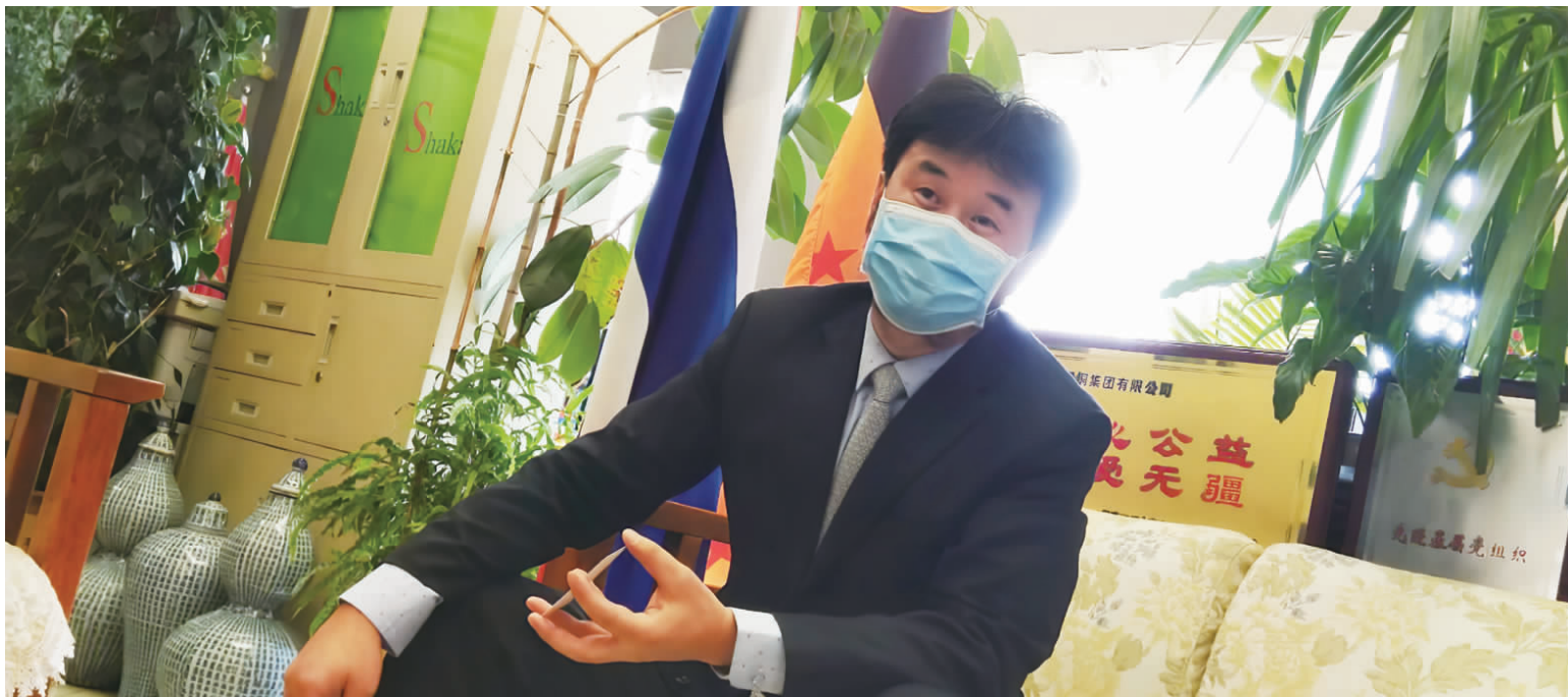
中国云铜的一名董事