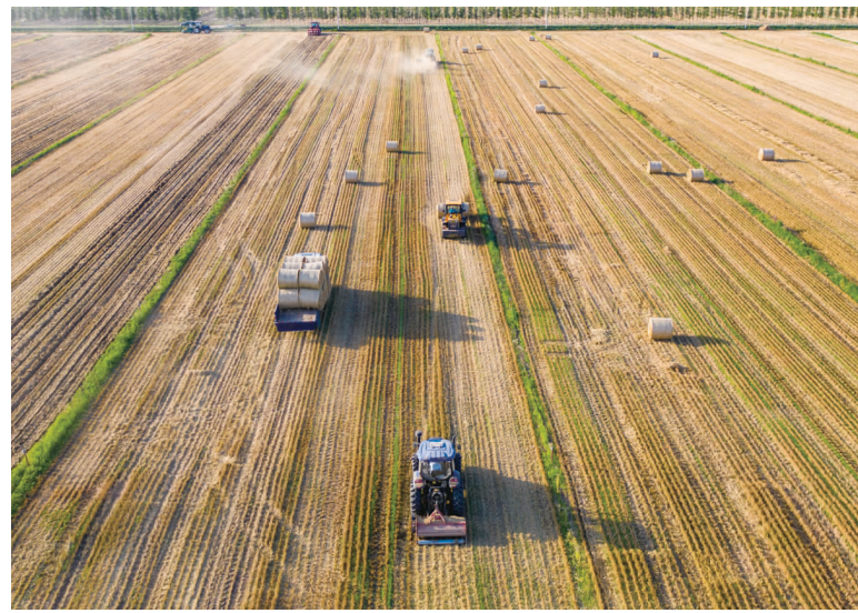
青阜村机械化秸秆打捆。