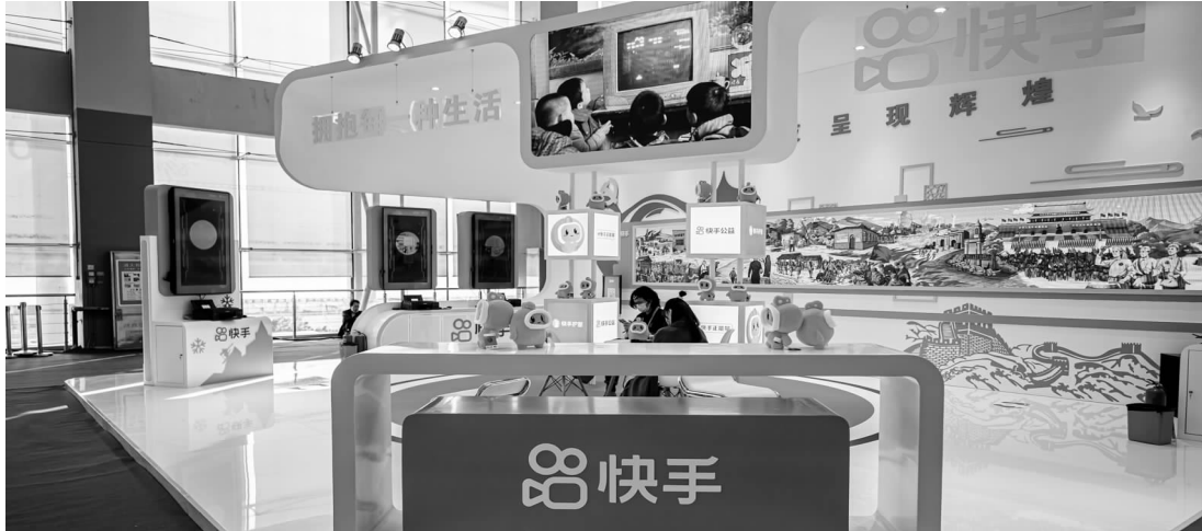
由程一笑亲自管理电商,可以更好地协调电商业务和商业化、直播等业务之间的资源整合。

行力加持电子商务业务板块,推动电子商务业务板块以更快的速度为快手提供用户资产变现能力。”多年来,快手电商业务的增长其实一直面临来自抖音电商的竞争压力。根据财报显示,快手2022年Q2电商GMV同比增长31.5%至1912亿元。今年上半年,快手电商GMV达到3662亿元,较上年同期的2640亿元,增长40%。而今年5月份的抖音电商第二届生态大会上,抖音电商透露,过去一年,抖音电商GMV是同期的3.2倍,卖了超过100亿件商品。另外,虽然抖音电商比快手电商晚了一年多才成为公司的一级业务部门,但抖音电商很早就开始布局品牌。这导致在品牌方看来,抖音电商已经成为品牌商家营销的新渠道,甚至有不少品牌认为快手是清库存的渠道。记者在快手方面获悉,快手在2021年下半年已经成立一个新的部门,专门为品牌和品牌广告商服务。并且快手正在引入更多的品牌产品,希望平台每笔订单的平均价值能从目前的100元左右进一步向上提升。接近快手的人士指出,快手电商业务确实还有很多可以提升的空间,例如目前快手的公域流量大于私域流量,但现在一半以上的电商交易总额来自私域流量,从电商角度来看公域流量还有待充分开掘。从品类上来说,目前快手在服装、美容和化妆品类别的集中度较高,在家居、宠物护理产品等方面有较强影响力,但是在许多垂直领域的渗透率仍然不足。