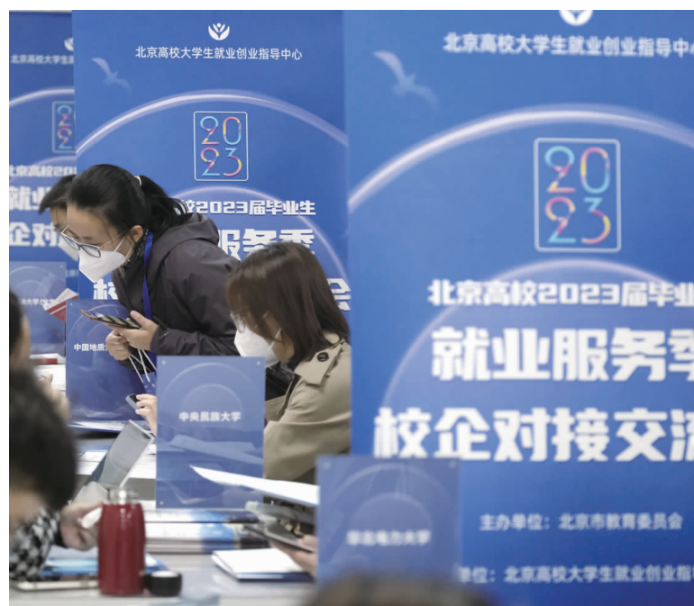
党的二十大报告聚焦就业的难点、焦点，部署实施就业优先战略。

生规模达到1076万人的新高，在国内外环境不确定性因素增多的情况下，促进就业的任务更重。