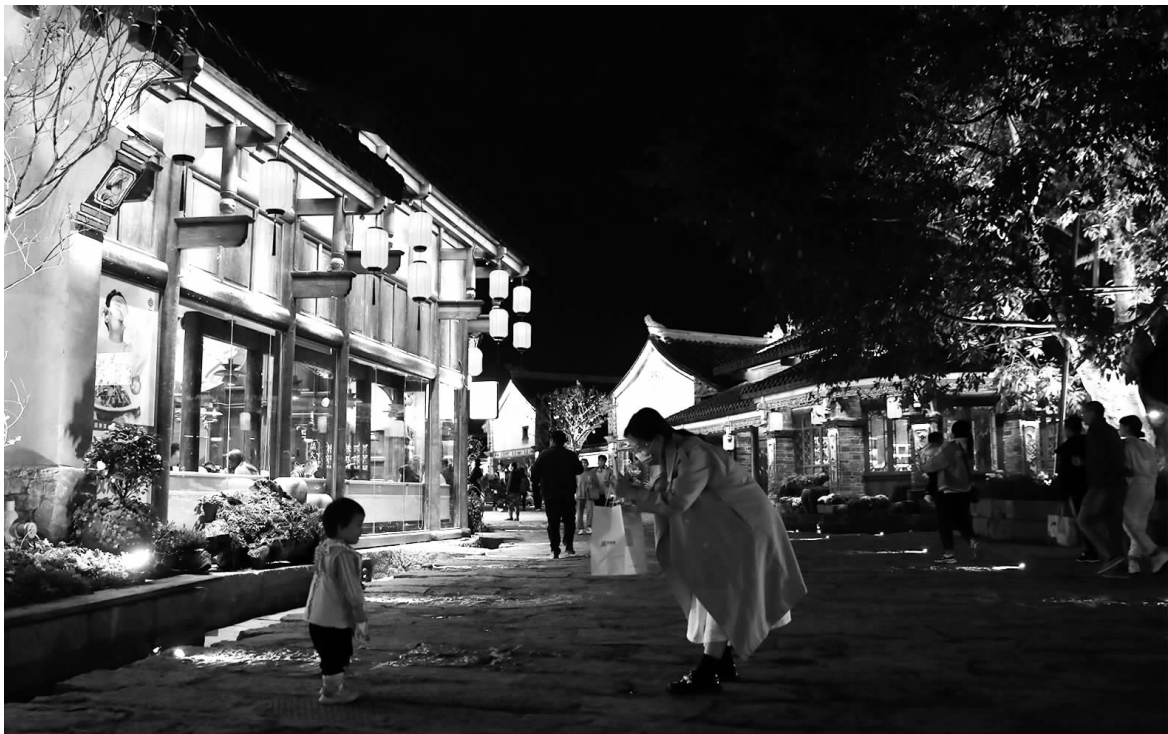
今年以来,多地加大力度推进重大文旅项目签约落地,促进文旅产业的融合发展。图为10月底的四川凉山,建昌古城夜景吸引游人观光。

“等到疫情结束的时候,旅游需求一定会迎来报复性反弹和爆发性增长。”一家文旅上市企业有关负责人向《中国经营报》记者表示,“过去三年疫情常态化背景下,文旅消费、产品、模式发生了深刻变化,也产生了新需求、新业态,比如滑雪、露营等。”