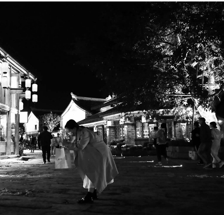
今年以来,多地加大力度推进重大文旅项目签约落地,促进文旅产业的融合发展。图为10月底的四川凉山,建昌古城夜景吸引游人观光。

近期,北京、湖南、四川、云南等地密集签约了数百个文旅项目,总投资规模逾千亿元,涵盖了夜间文旅、城市更新、康养体育、冰雪温泉、研学旅行、乡村振兴、旅游景区等各