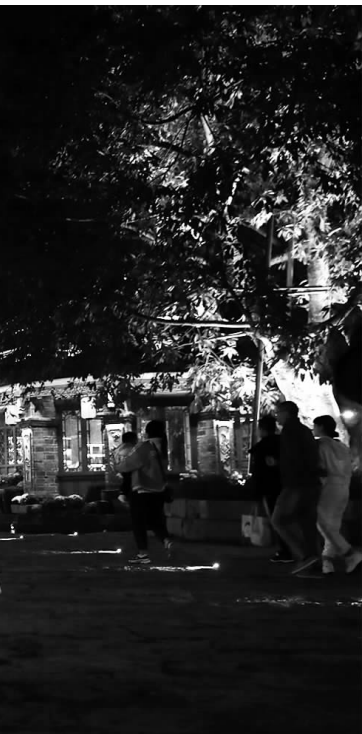
今年以来,多地加大力度推进重大文旅项目签约落地,促进文旅产业的融合发展。图为10月底的四川凉山,建昌古城夜景吸引游人观光。

今年初,国务院印发了《“十四五”旅游业发展规划》,我国将全面进入大众旅游时代,旅游业发展仍处于重要战略机遇期,但机遇和挑战都有新的发展变化,需要充分利用旅游业涉及面广、带动力强、开放度高的优势,将其打造成为促进国民经济增长的重要引擎。