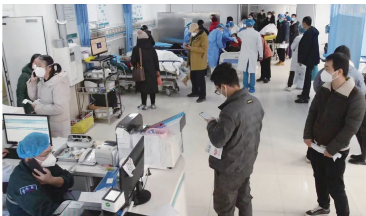
春节期间，患者在巴彦淖尔市医院急诊科就诊。

为全力应对可能发生的新冠重症救治高峰，确保危重症医疗救治工作落实到位，巴彦淖尔市医院科学统筹调度病区、人力、物资等各类资源，在全院范围内整合、调配重症床位，紧急购置各类抢救设备，以全力保障危重症患者、高