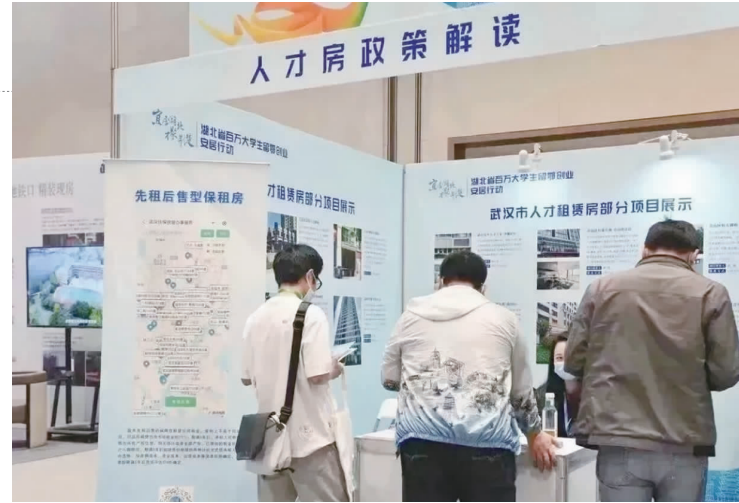
日前，湖北房交会在武汉市正式拉开帷幕，有效拉动了当地楼市成交量上涨。

青年人才群体给出的政策优惠力度最大。例如，武汉经开区在湖北省率先推出“春笋行动”普惠制政策，给所有来武汉经开区工作的大学生购房、购车、租房补贴，包括最高15万元的购房补贴和1万元的购车补贴，人才租房补贴政策保障力度在武汉市也是最大的。