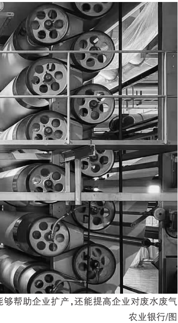
浙江迎丰科技股份有限公司通过排污权抵押向银行贷款,贷款资金用于技术改造和产业并购,不仅能够帮助企业扩产,还能提高企业对废水废气的处置能力。

企业的融资痛点。同时,该行将贸易投融资便利化、汇率避险等金融服务融入到外贸企业实际业务中,提升了企业的抗风险能力,让企业能够更顺利地“出海”拓市场。