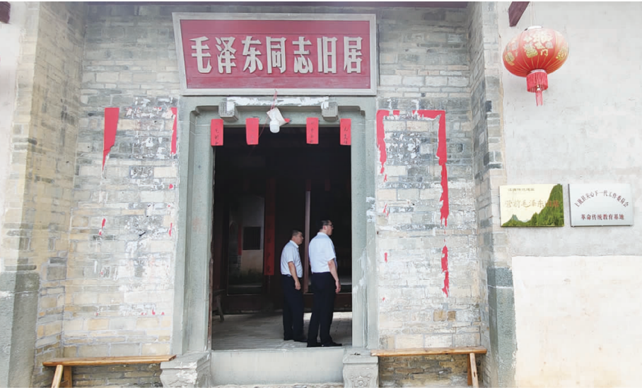
上犹县充分挖掘红色资源禀赋,建设开放多处革命传统教育基地。图为毛泽东同志在上犹曾居。

采访中,两位同姓的村民坐在一起有说有笑,其中一位村民吴某告诉记者:“之前我们闹得不可开交,多亏了一位驻村帮扶队员帮我们调解。”原来,另外一位吴姓村民曾经偷摘老吴山场的油茶籽,引发争议。挂职干部在了解情况后,邀请驻村村领导、林管部门工作人员、原分山现场人员到山场进行现场调解,经耐心调解协议,经原分山见证人确认,双方当事人协商后签字,一场乡邻纠纷得以双方当事人握手言和而告终。“只有从源头上把一些矛盾预防及时化,基层组织的根基才能得到巩固,乡村才能更加和谐。”挂职干部说,在大家的共同努力下,元鱼村的平安乡村建设工作上迈上新台阶,被评为2022年度全