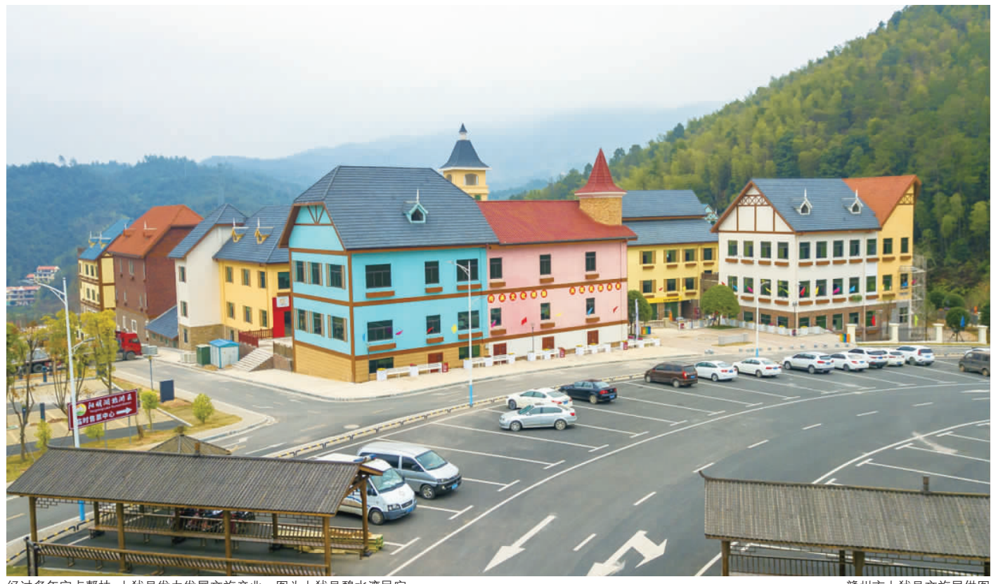
经过多年定点帮扶,上犹县发力发展文旅产业。图为上犹县碧水源民宿。