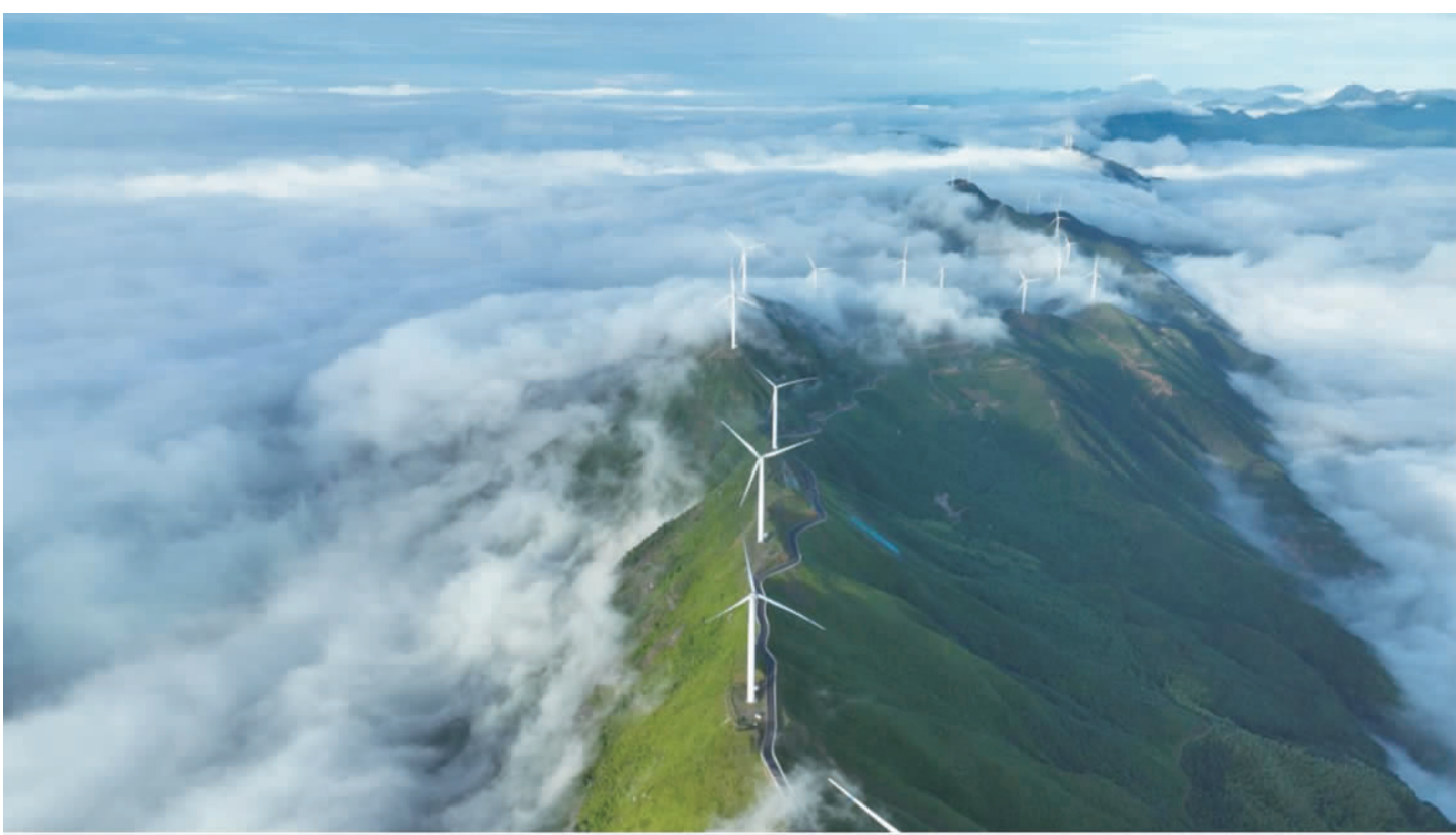
中国社会科学院通过帮扶项目做强做大“山水文章”。图为上犹县双溪山风景区。