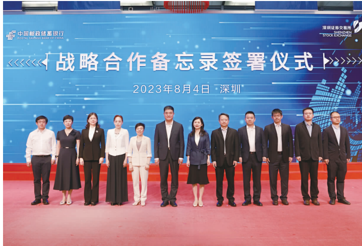
8月4日,中国邮政储蓄银行与深交所签署战略合作备忘录,在多方面开展合作,满足企业多元化投融资需求,更好地服务优质创新企业,助力现代化产业体系建设。

邮储银行与深交所签署战略合作备忘录,并共同组织投融资路演专场活动,对深化双方全面合作,全力打造科创金融服务生态圈具有重要意义。“专精特新”及科创企业的成长离不开交易所、商业银行、创投机构、证券公司及科研院所等各类机构的共同助力。