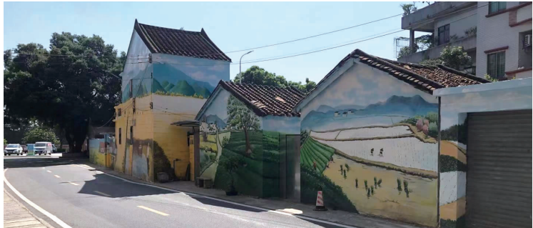
东莞证券助力东莞市望牛墩镇芙蓉沙村引桥沿线涂鸦工程项目

另一方面，凝聚基层力量，激活“雁群齐飞”。坚持自上而下发动职工组建志愿服务队，推进志愿服务常态化，引领职工聚焦慰问特殊群体、公益宣传、生态环保等多个领域，广泛开展2023年“6·30”助力乡村振兴帮扶送温暖慰问、“投资者教育进百校”等乡村振兴和公益慈善活动，有力推动公益文化融入公司日常经营和文化血脉。