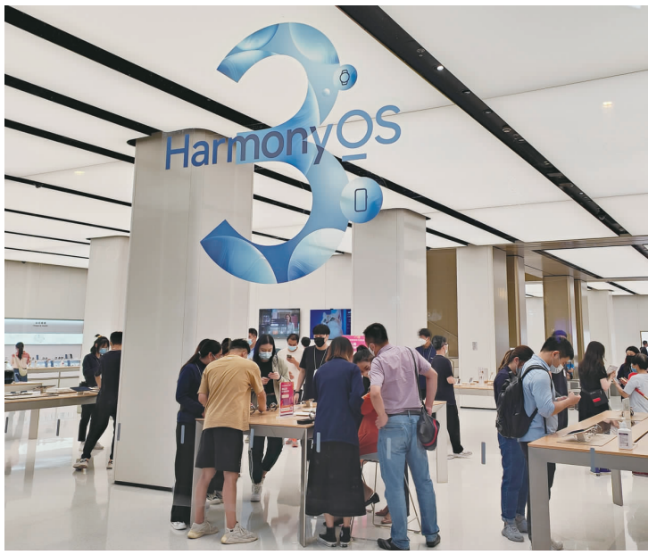
HarmonyOS 鸿蒙原生应用开发正在加速。

业均表现出鸿蒙适配意向,推进旗下应用的开发。10月,有媒体报道,腾讯宣布微信将以原生方式适配鸿蒙系统,成为首批接入鸿蒙生态的社交应用;旗下的包括 QQ 音乐、王者荣耀等热门应用也在加入鸿蒙系统。