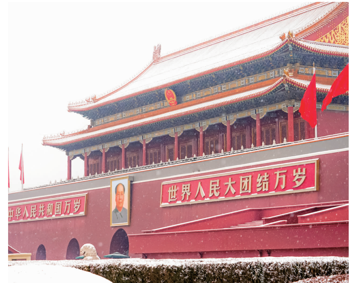
中央经济工作会议强调，要积极培育文娱旅游消费增长点。图为12月11日，北京迎来2023年冬首场降雪。

在中诚信国际信用风险年会上，岳志岗介绍，对中国经济增速的预判，主要基于三点考虑。