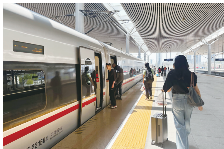
5月15日,京沪高铁列车在泰安站停靠。

中国国家铁路集团有限公司(以下简称“国铁集团”)人士对《中国经营报》记者表示,京沪高铁收入与客流出现一升一降的主要原因是票价因素。目前,京沪高铁已经形成了市场为导向的票价机制,在客流高峰期形成了七档票价浮动方案。