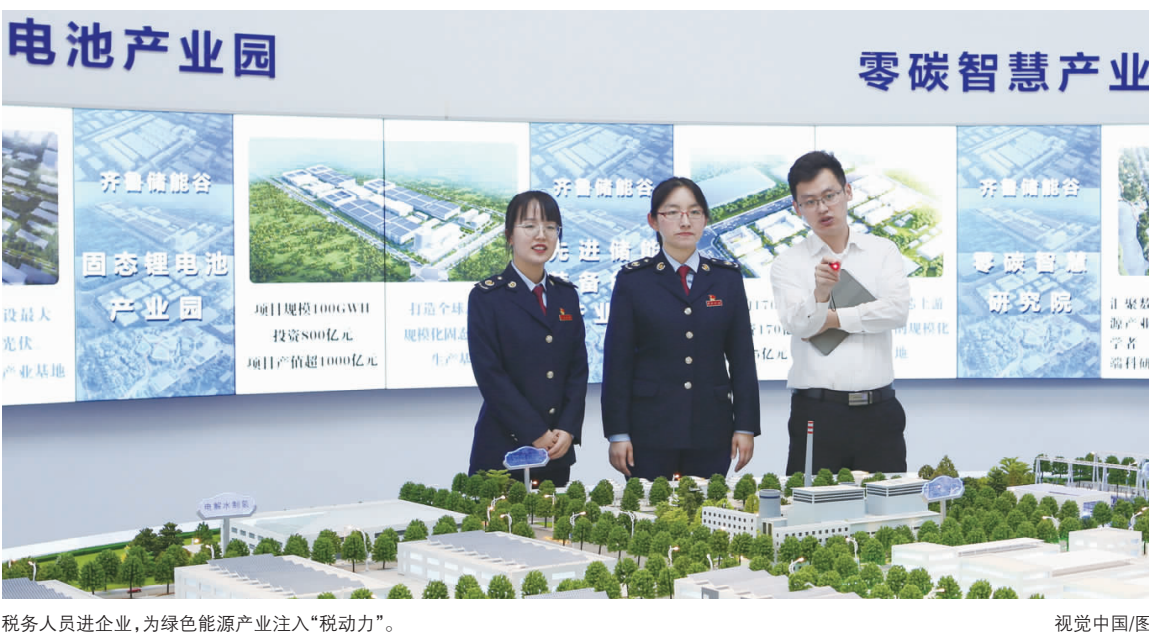
税务人员进企业,为绿色能源产业注入“税动力”。

加计扣除金额1.6亿元,高新技术企业减免优惠8264万元,这为企业研发创新给予了充足的资金支持。