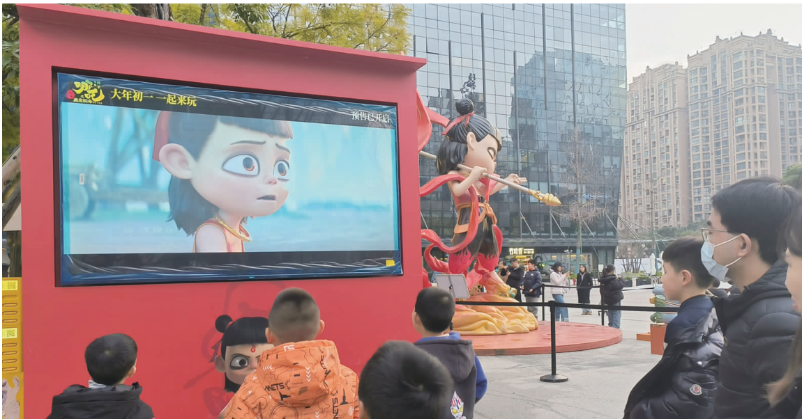
《哪吒2》上映后，众多成都市民在街头欣赏电影片段。