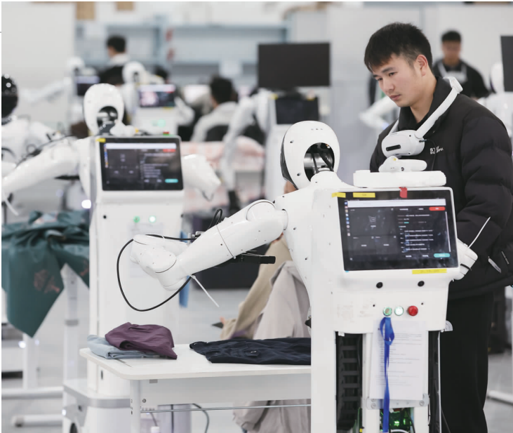
图为上海首座人形机器人量产工厂。

值得注意的是,“两重”“两新”已经成为多地“一把手”工程。今年2月,湖北省委书记王忠林在省委专题会议上提出,要强化政策把握。研深吃透、精准对接国家政策,统筹抓好“硬投资”和“软建设”,提前做好配套准备,确保各项工作符合国家政策导