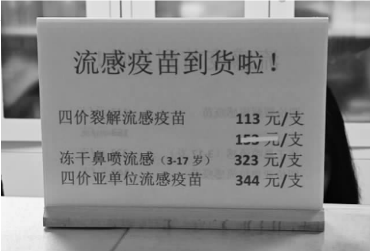
天津市东丽区张贵庄社区卫生服务中心流感疫苗价格单。

星雅立峰的三价流感疫苗在深圳市在校中小学生流感疫苗免费接种项目中以8元/支中标;6月,上海生物制品研究所和长春生物制品研究所更是以单支6元的价格,在浙江省疾病预防控制中心2025年群体性预防接种流感疫苗(省级)项目中中标。 2025年9月,北京市政府采购网公布的《2025年流感疫苗招标采购项目(免疫)中标公告》显示,上海生物制品研究所三价流感疫苗中标单价降至5.5元/支,创下历史新低。 据了解,目前市面上的流感疫苗包括三价和四价。四价流感疫苗比三价多覆盖一种乙型流感病