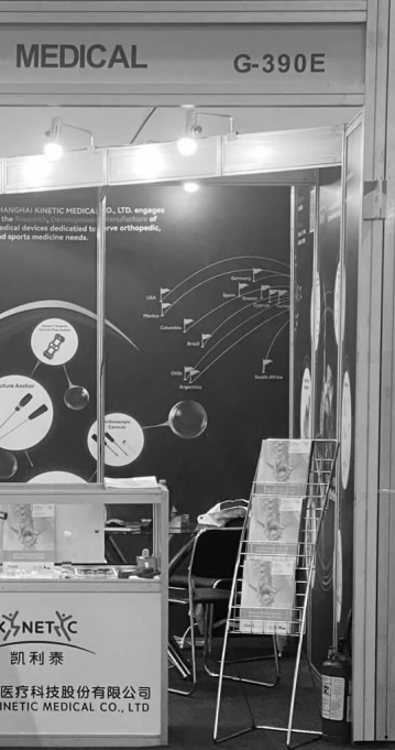
11月27日，ST凯利披露了整改报告。图为ST凯利展台。

针对关联交易相关疑问，《中国经营报》记者联系了ST凯利方面。不过截至发稿对方未作答复。