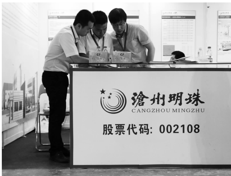
图为第十一届中国国际电池产品展示交易会沧州明珠展台。